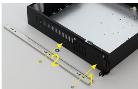
Przykręć prowadnicę dwoma śrubami do obudowy ARAD (pamiętaj o podkładce dystansowej pod drugą śrubą)