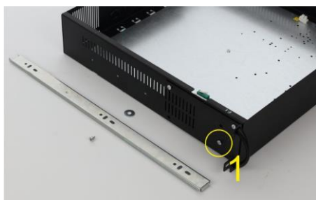
Odkręć pierwszą śrubę M4 z obudowy ARAD