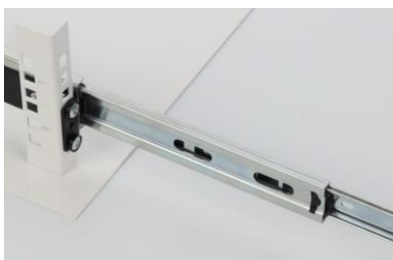
Wysuń prowadnicę z szyny ARAS

3.2. Zdemontować prowadnicę i dokręcić ją do obudowy ARAD (śruba M4 + podkładka). Obudowa montowana jest do RACK-ów od czoła 4 śrubami M6.