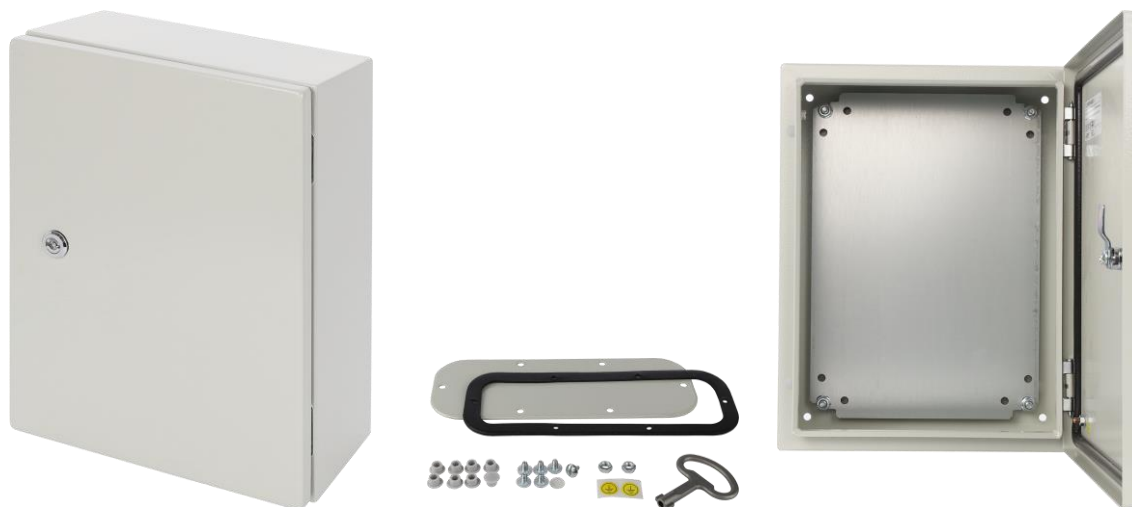
Rysunek 1. Widok obudowy.