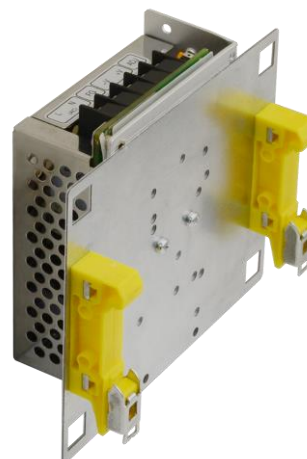
Rys. 2. Przykład montażu zasilacza: PSB-351225