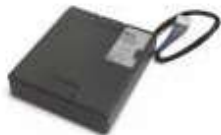
PS324 akumulator 24V 2.2 Ah z wbudowaną kartą ładowania do centrali MC824H