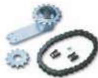
BMA1 akcesoria zwiększające kąt otwarcia do 180°