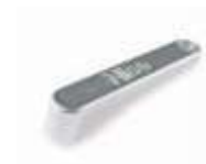
MEA5 dźwignia odblokowująca do MEA3 (dodatkowa)