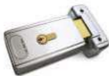
PLA11 zamek elektromagnetyczny poziomy