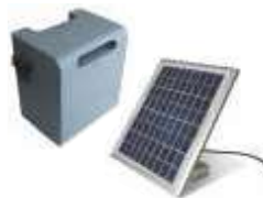
SOLEMYO (SYKCE) zestaw zasilania słonecznego