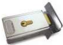
PLA10 zamek elektromagnetyczny pionowy