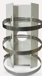
Uchwyt słupowy HQ-SŁ-T