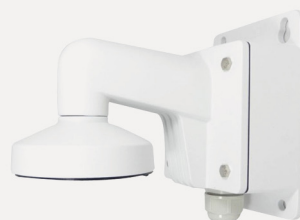
Uchwyt ścienny HQ-USC-BD