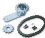
MEA1 akcesoria zwiększające kąt otwarcia do 180°