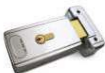
PLA11 zamek elektromagnetyczny poziomy