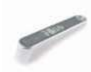
MEA5 dźwignia odblokowująca do MEA3 (dodatkowa)