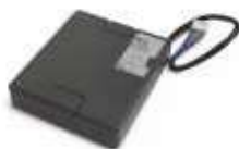
PS324 akumulator 24V 2.2 Ah z wbudowaną kartą ładowania do centrali MC824H