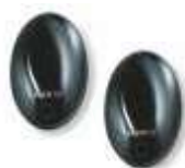
BF fotokomórka (para) zasięg 15-30m