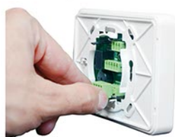
Rozłączne listwy zaciskowe