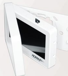
Obsługa kart SD: plan obiektu, cyfrowa ramka

Wersje - funkcjonalnie wszystkie wersje są identycznie – różnią się jedynie sposobem zasilania oraz obudowami