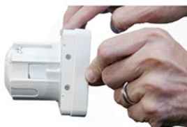
Montaż na typowej puszcze instalacyjnej f160